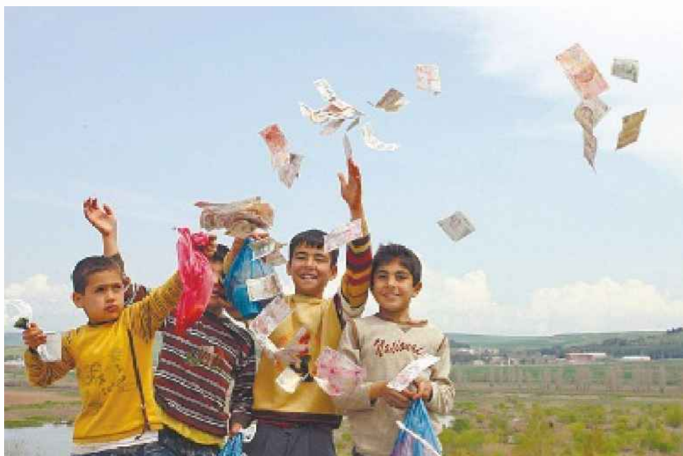
סניף טקין, מתוך סדרת תצלומים, 2009-2013