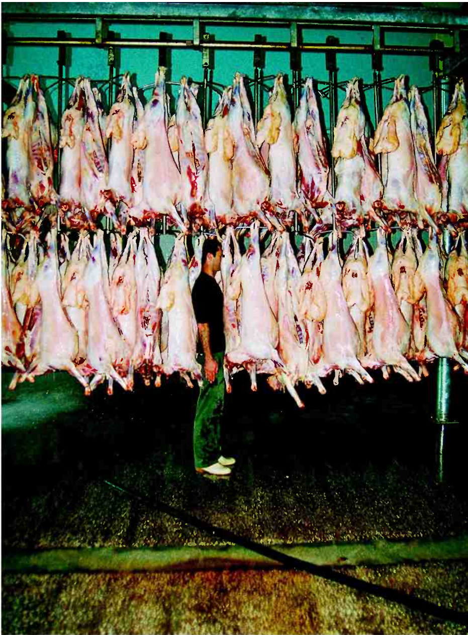
Enentegre (2007) מאת סנקיזו טקין במוזיאון למורשת הפלסטינית בסח'נין